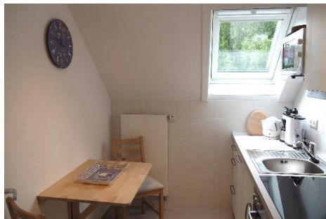
Voll ausgestattete Küche mit Backofen, Mikrowelle und Geschirrpüler