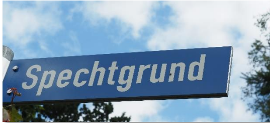
Neu renovierte 2 Zi.-Appartement in der 2. Etage eines Wohnhauses in Mölln