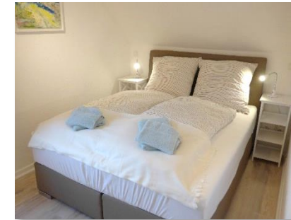
Schlafraum mit Boxspringbetten