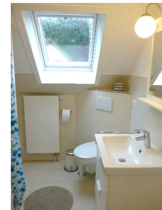
Duschbad mit Waschmaschine

Das Appartement Buntspecht befindet sich direkt neben der Klinik Föhrenkamp. Ganz in der Nähe ist der Wildpark, das Naturzentrum Uhlenkolk, der Kurpark, das Schwimmbad Möllner Welle und die historische Altstadt Mölln mit der Nikolaikirche und Till Eulenspiegel. Die Hansestädte Hamburg und Lübeck sind per Bus, Bahn oder PKW schnell erreichbar. PKW-Stellplatz und abschließbare Fahrradstellplätze sind vorhanden. Haustier auf Anfrage, Nichtraucherwohnung,